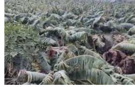
तात्काळ काढून टाकावे. दीर्घकाळ पाणी साचल्यास मुळांना इजा होऊन झाडे सडण्याची शक्यता वाढते. मुळांच्या वाढीसाठी ह्युमिक अॅसिड किंवा समुद्री शेवाळ अर्काचा वापर करण्याचा सल्ला देण्यात आला आहे. झडजखमी झालेल्या झाडांवर बुरशीजन्य रोगांचा प्रादुर्भाव होऊ नये यासाठी कॉपर ऑक्सीक्लोराइड (३ ग्रॅम) किंवा मॅन्कोझेब (२.५ ग्रॅम) प्रति लिटर पाण्यात मिसळून फवारणी करावी. तसेच जखमेत पाणी साचणार नाही याची दक्षता घ्यावी.