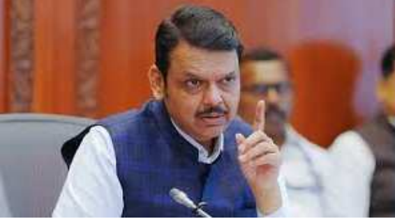
अशी साथ मिळाल्यास आरोग्य, शिक्षण आणि सामाजिक विकासाची उद्दिष्टे अधिक वेगाने साध्य होऊ शकतात. म्हणूनच समाजातील दुर्बल घटकांच्या उन्नतीसाठी सार्वजनिक आणि खासगी क्षेत्रातील भागीदारी अधिक बळकट होणे आवश्यक आहे. कॉर्पोरेट क्षेत्राच्या सामाजिक बांधिलकीचे हे एक उत्कृष्ट उदाहरण ठरत असल्याचे नमूद करून मुख्यमंत्री फडणवीस म्हणाले की, अफकॉन्सने शिक्षण क्षेत्राबरोबरच महिला सक्षमीकरण आणि आरोग्यविषयक उपक्रमांमध्ये केलेली गुंतवणूक ही शाश्वत विकासाच्या दृष्टीने महत्त्वाची आहे. समाजातील गरजू घटकांच्या जीवनमानात सकारात्मक बदल घडवून आणण्यासाठी अशा सीएसआर उपक्रमांची भूमिका अत्यंत मोलाची ठरते.

प्रक्रियेला गती देणारी आणि त्यांच्या कुटुंबांना दिलासा देणारी ठरली आहे. शासनाच्या प्रयत्नांना उद्योग क्षेत्राची