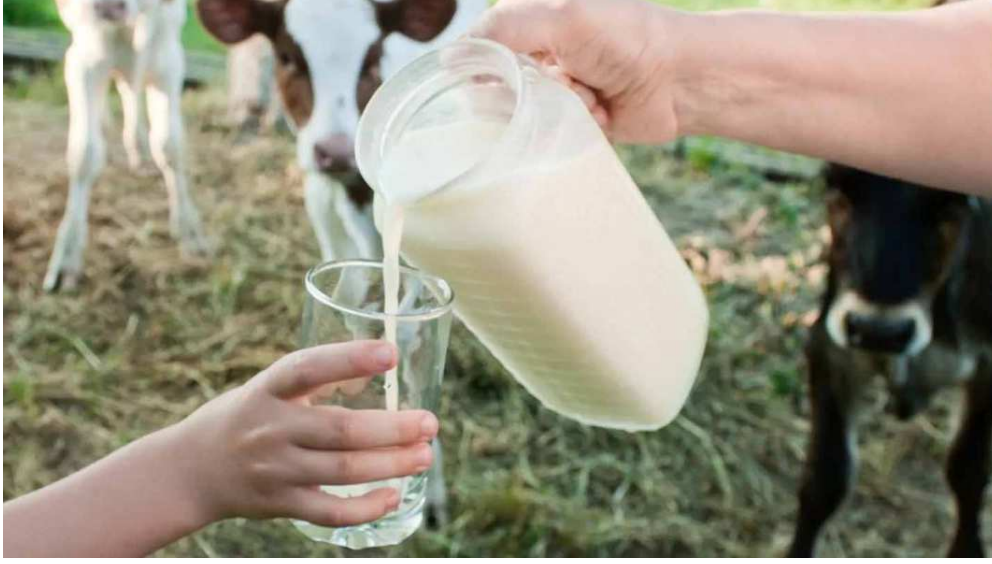
पानमसाला आणि खाद्यपदार्थांमध्ये भेसळ करणा-यांविरुद्ध जोरदार मोहीम हाती घेतली आहे. या मोहिमेअंतर्गत अवघ्या १५ दिवसांत कोट्यवधींचा माल जप्त करून जवळपास २५०