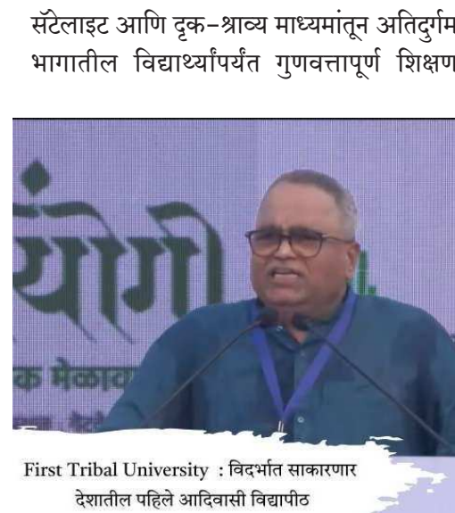
First Tribal University : विदर्भात साकारणार देशातील पहिले आदिवासी विद्यापीठ