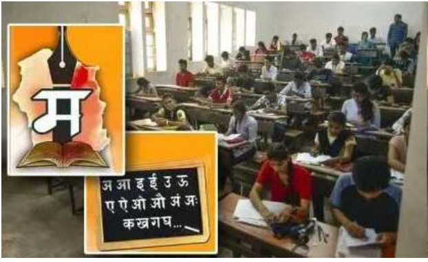
यासाठी शालेय शिक्षण विभागाने मराठी

राज्यातील सर्व शाळांमध्ये इयत्ता पहिली ते दहावीपर्यंत मराठी भाषा