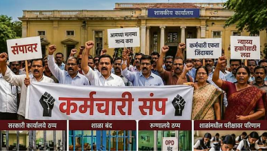
गेल्या वर्षभरात सात वेळा संघटनात्मक लक्षवेधी आंदोलने छेडली. परंतु सरकारने आंदोलनांची कोणतीही दखल

माहिती राज्य सरकारी कर्मचारी संघटनेने दिली. एकूण १८ प्रलंबित मागण्यांकडे सरकार जाणीवपूर्वक दुर्लक्ष करित आहे का ? असा प्रश्न कर्मचाऱ्यांपुढे उभा राहिला आहे. याच मानसिकतेतून राज्यातील १७ लाख कर्मचारी-शिक्षक २१ एप्रिलपासून बेमुदत संपावर जाणार आहेत. विश्वास काट कर (निमंत्रक, कर्मचारी समन्वय समिती, महाराष्ट्र)