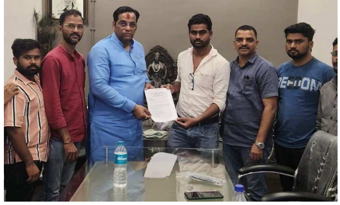
असताना न्युज पेपर

वेळ बदलल्याबाबत आणि वडापाव किंवा इतर पदार्थ पार्सल करत