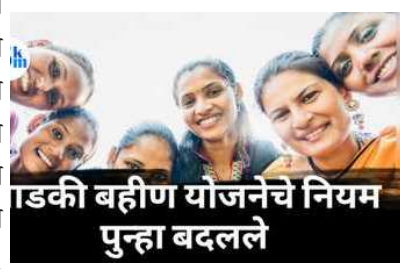
लाडकी बहीण योजनेचे नियम पुन्हा बदलले

ईएसडीएसकडून विदा स्थलांतरित करण्यात येणार असल्याचे कळविण्यात आले आहे. या कामासाठी २४ तासांचा कालावधी लागणार असून या कालावधीत 'आयसरिता' दस्त नोंदणीसह सर्व सेवा उपलब्ध असणार नाहीत. त्यामुळे शुक्रवारी (२६ जुलै) रात्री साडेनऊ वाजल्यापासून शनिवारी (२७ जुलै) रात्री उशीरापर्यंत विदा स्थलांतराचे काम सुरू राहणार आहे. परिणामी शनिवारी राज्यभरातील दस्त नोंदणी कार्यालयांचे कामकाज बंद राहणार आहे. रविवारी (२८ जुलै) राज्यातील जी दस्त नोंदणीची कार्यालये सुरू असतात, त्या कार्यालयांमध्ये दस्त नोंदणीचे कामकाज सुरू राहणार आहे, असे आदेशात नमूद करण्यात आले आहे.