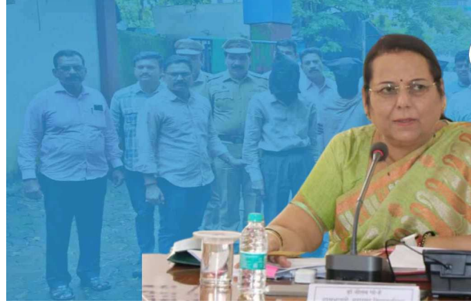
बलात्कार केला. त्यानंतर तीची निर्घृण हत्या केली. मंदिराच्या मागील बाजूस नेऊन हा सर्व प्रकार ६ जुलै रोजी

नवी मुंबईतील एनआरआय पोलीस ठाणे हद्दीतील राहणारी विवाहित महिला कौटुंबिक छळाला कंटाळून ६ जुलै रोजी सकाळी शिळफाटा घोळ गणपती मंदिरामध्ये आली होती. त्यावेळी तिला दुपारी जेवण देऊन विश्वास संपादन केला. सायंकाळी महिलेच्या चहामध्ये भांग मिसळून तिला बेशुद्ध करण्यात आले. त्यानंतर रात्रभर तिच्यावर राक्षसी प्रवृत्तीच्या पुजाऱ्यांनी जबरदस्तीने आळीपाळीनं