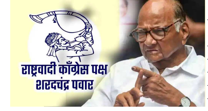
राष्ट्रवादी काँग्रेस पक्ष शरदचंद्र पवार

निर्माण झाला होता. आयोगाने पक्षनाव व चिन्ह बहाल केल्यामुळे देणग्या घेण्याचीही परवानगी असली पाहिजे व इतर राजकीय पक्षांना देणग्या स्वीकारताना मिळणारी करसवलतही